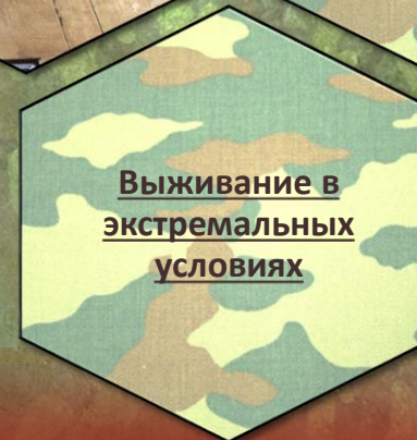
Выживание в экстремальных условиях